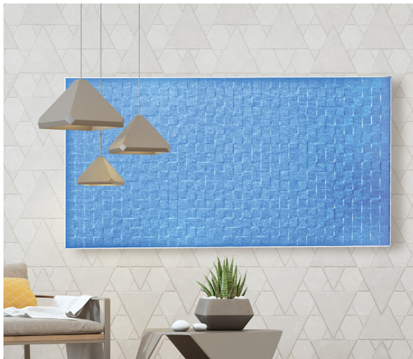
Sky blue SQUARE

For the PRO DIMENSION products, our SMART FLEECE is thermally formed into three different patterns: SQUARE, HEXAGON and TRIANGLE. In this way, wall and ceiling elements can be designed extraordinarily and loosen up the room. The 3D shapes are shown as examples on three different SMART FLEECE surfaces.