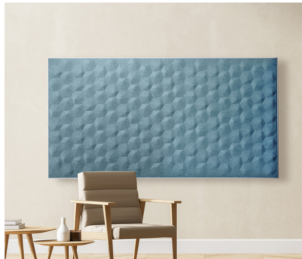
Mint turquoise HEXAGON